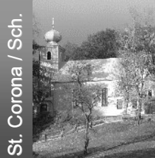
St. Corona / Sch.